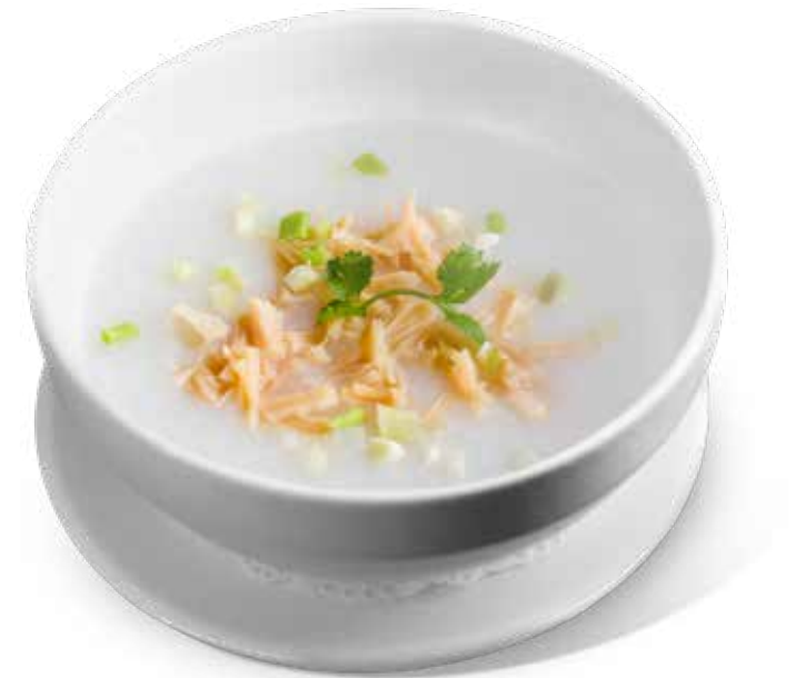
50 瑤柱靚白粥 Dried Scallop Congee Cháo Trắng Sò Điệp Khô 90,000