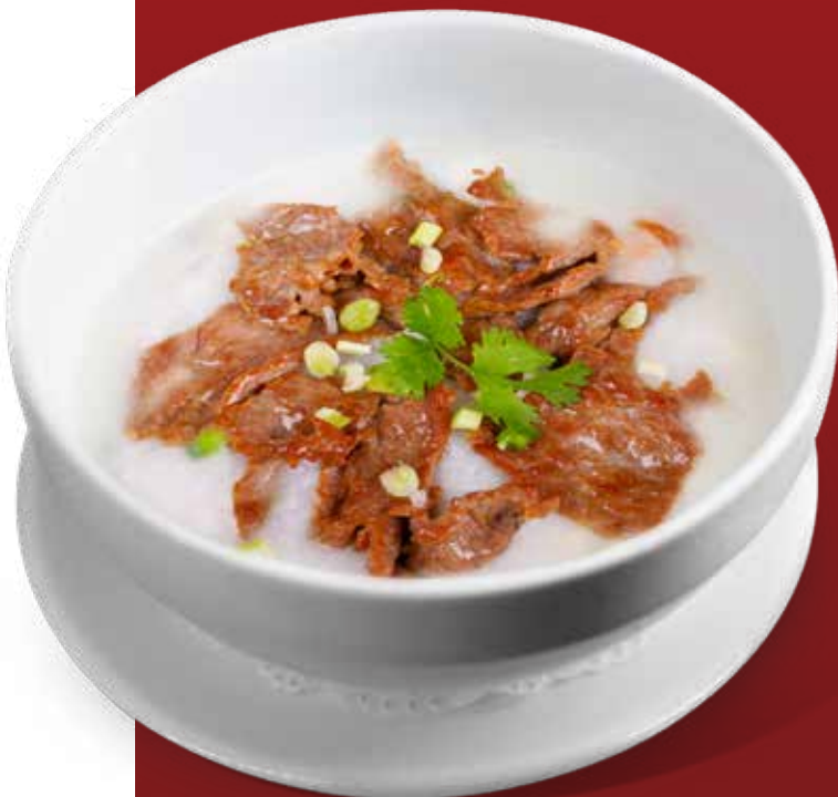
49 香茜牛肉粥 Beef Congee Cháo Thịt Bò 160,000