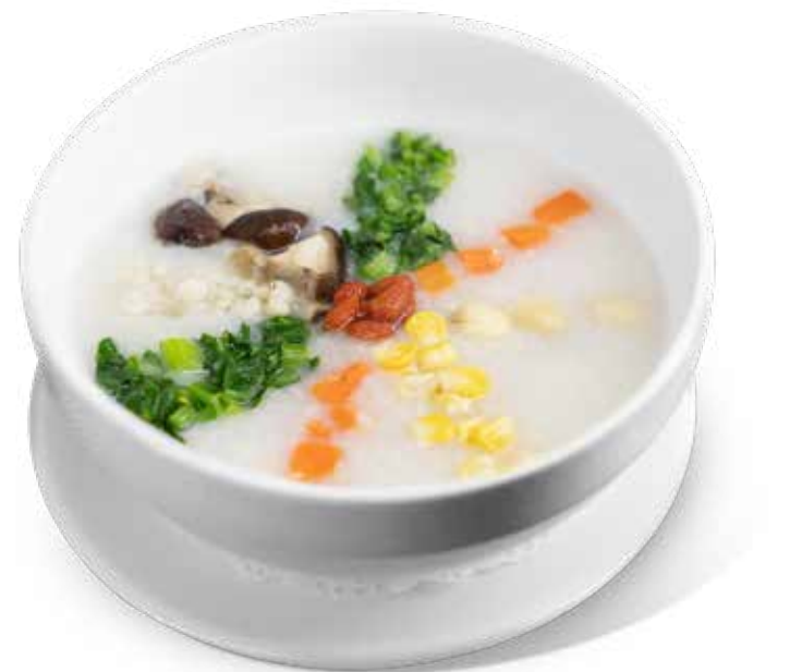
52 八寶營養粥 Vegetables Congee Cháo Rau Củ Dinh Dưỡng 70,000