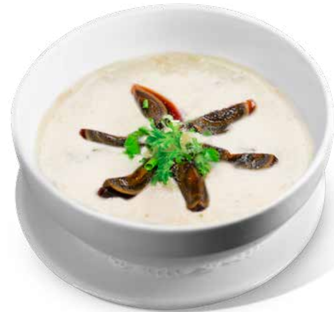
51 皮蛋瘦肉粥 Century Egg and Lean Meat Congee Cháo Bắc Thảo Thịt Heo 90,000