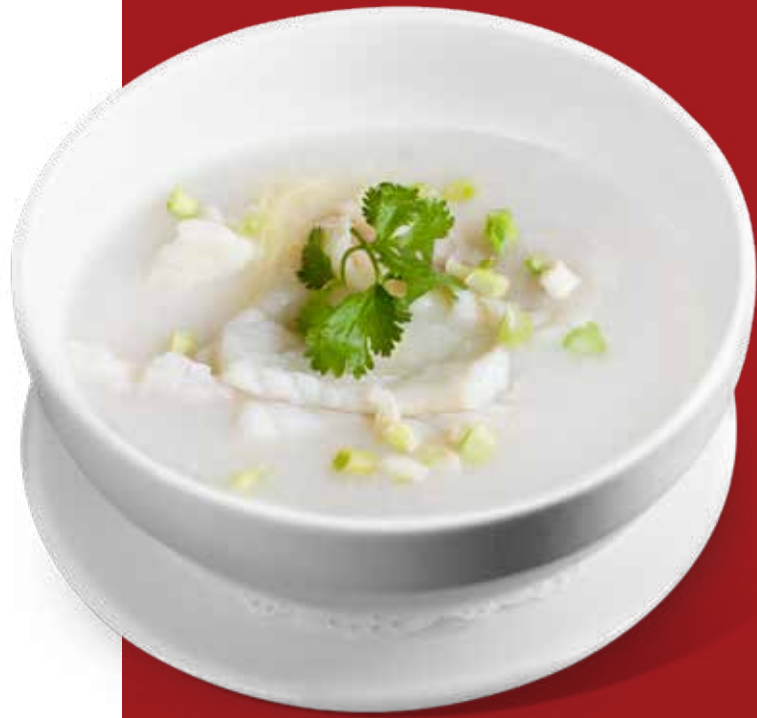
48 生滾斑球粥 Grouper Fillet Congee Cháo Cá 160,000